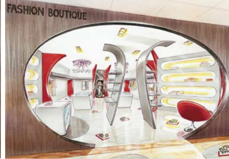
THE WIDE MOUTHS OPEN ONTO THE ELEGANT BOUTIQUES; SEEN FROM ABOVE, GOBBETTO RESIN DROPS PERSONALIZED WITH THE LOGO OR BRAND NAMES LEAD TRAVELERS ALONG A SINUOUS PATH. LE AMPIE "BOCCHE" SI APRONO SULLE ELEGANTI BOUTIQUE; NELLA VISTA DALL'ALTO SPOT IN RESINA DI GOBBETTO PERSONALIZZATI CON LOGO E MERCEOLOGIE GUIDANO IL VIAGGIATORE IN UN SINUOSO PERCORSO